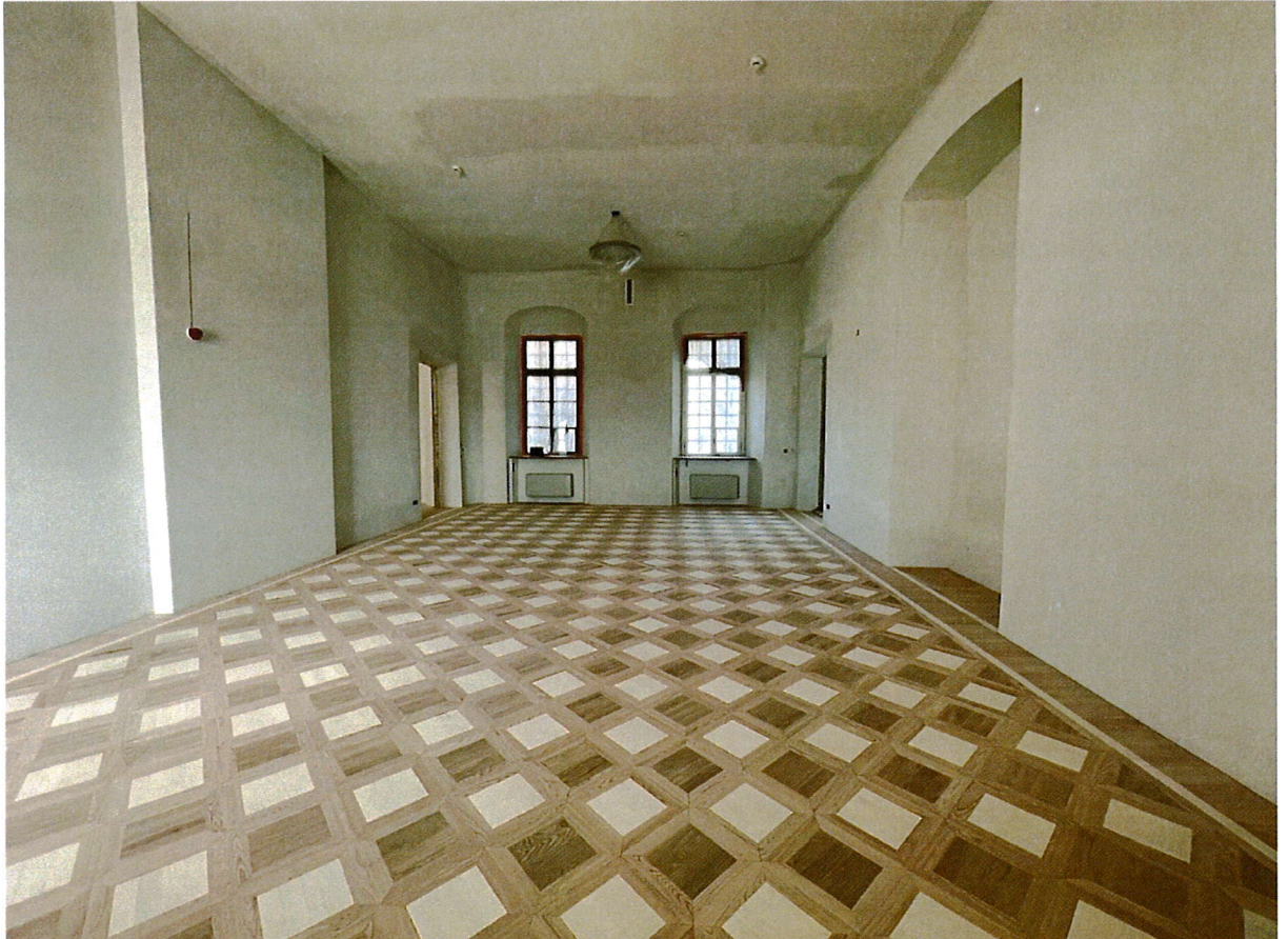
Zdjęcie nr 5 – Pałac Potockich