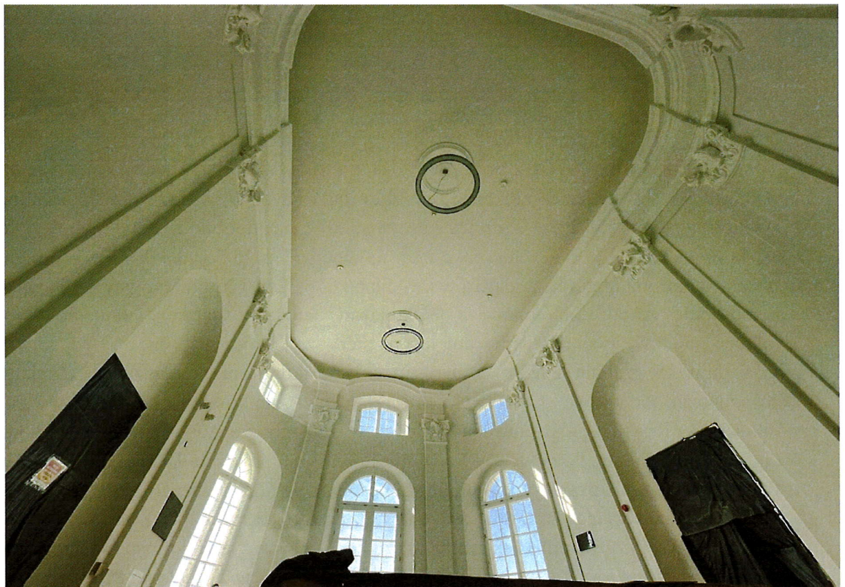
Zdjęcie nr 6 – Pałac Potockich