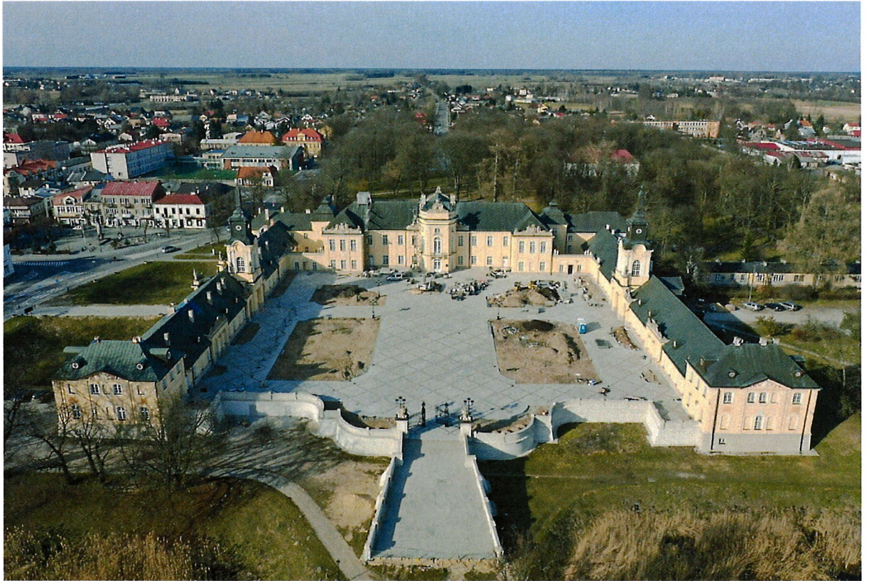
Zdjęcie nr 1 – Działanie Pałacu