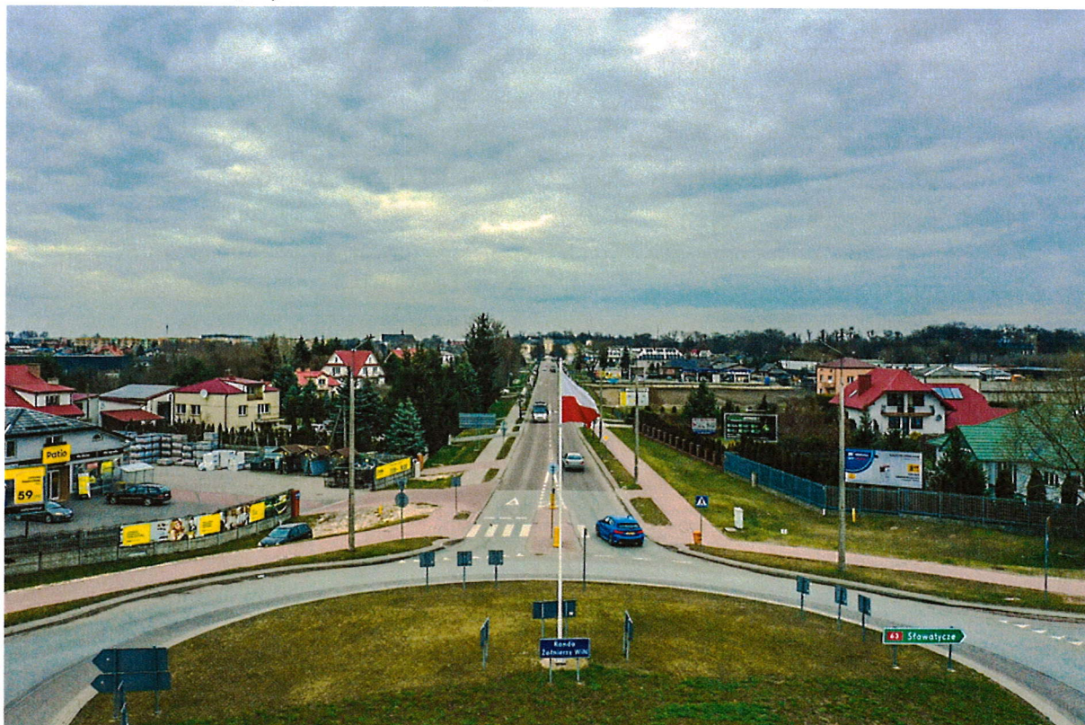
Zdjęcie nr 8 Maszt – Rondo Żołnierzy WiN

Plan – 12 000,00 zł, wykonanie – 12 000,00 zł