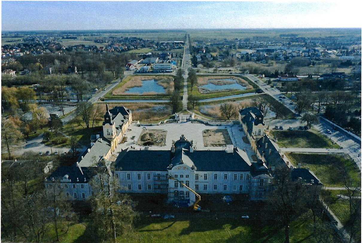
Zdjęcie nr 3 – Palac Potockich