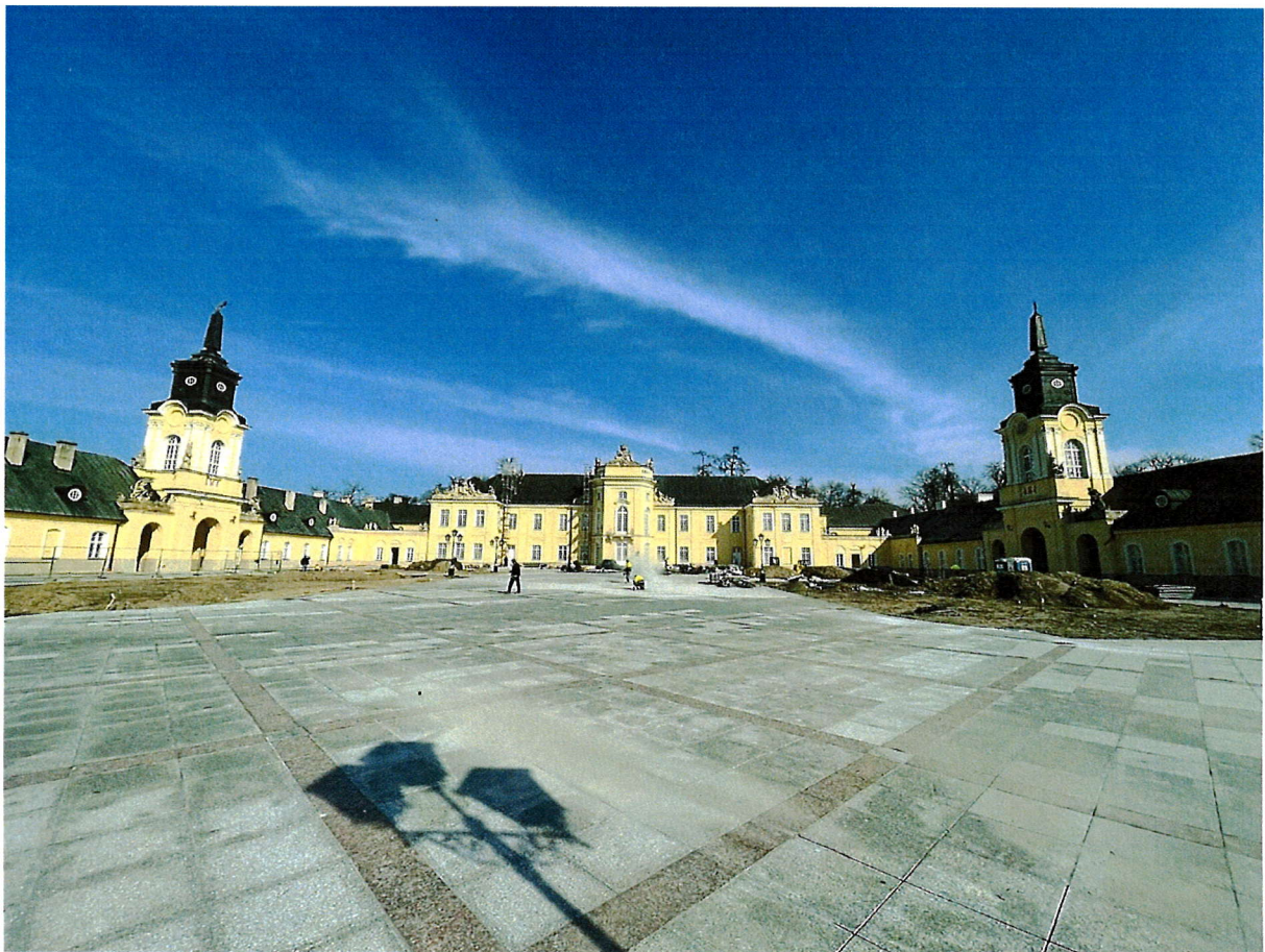
Zdjęcie nr 4 – Palac Potockich