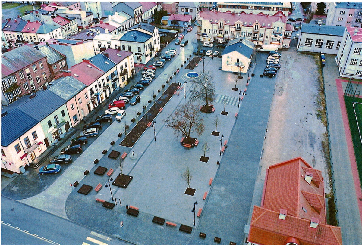
Zdjęcie nr 7 – Rynek

- w dniu 20 kwietnia 2021 r. z firmą SORTED Sp. z o. o. z siedzibą w Chyliczkach, w zakresie – Rewitalizacji placu publicznego „Rynek” w Radzynie Podlaskim, na kwotę łączną 3 267 240,00 zł. W dniu 25 lutego 2022 r. podpisano aneks do umowy, na podstawie którego zmieniono niektóre rozwiązania techniczne wykonania przedmiotu umowy, natomiast w dniach 29 czerwca i 29 września 2022 r. podpisano dwa aneksy do umowy, które ustalały nowe terminy zakończenia inwestycji odpowiednio na dzień 30 września 2022 r. i 9 listopada 2022 r. Inwestycje odebrano w dniu 9 listopada 2022 r.,