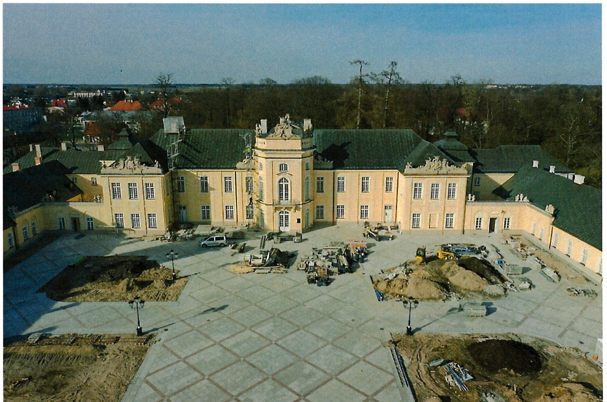
Zdjęcie nr 2 – Działanie Pałacu